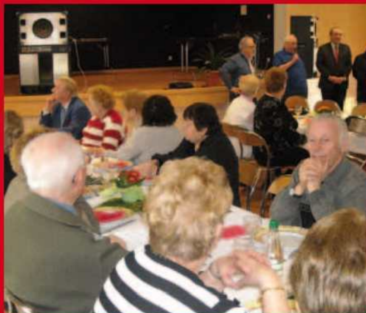
Rencontre de l'Association Loisirs Animations «FORBACH WIESBERG» avec leurs homologues meusiens au Foyer de Marienau