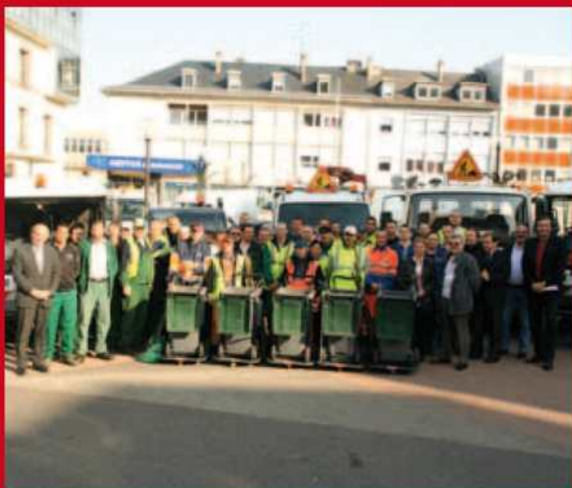
Campagne ville propre.