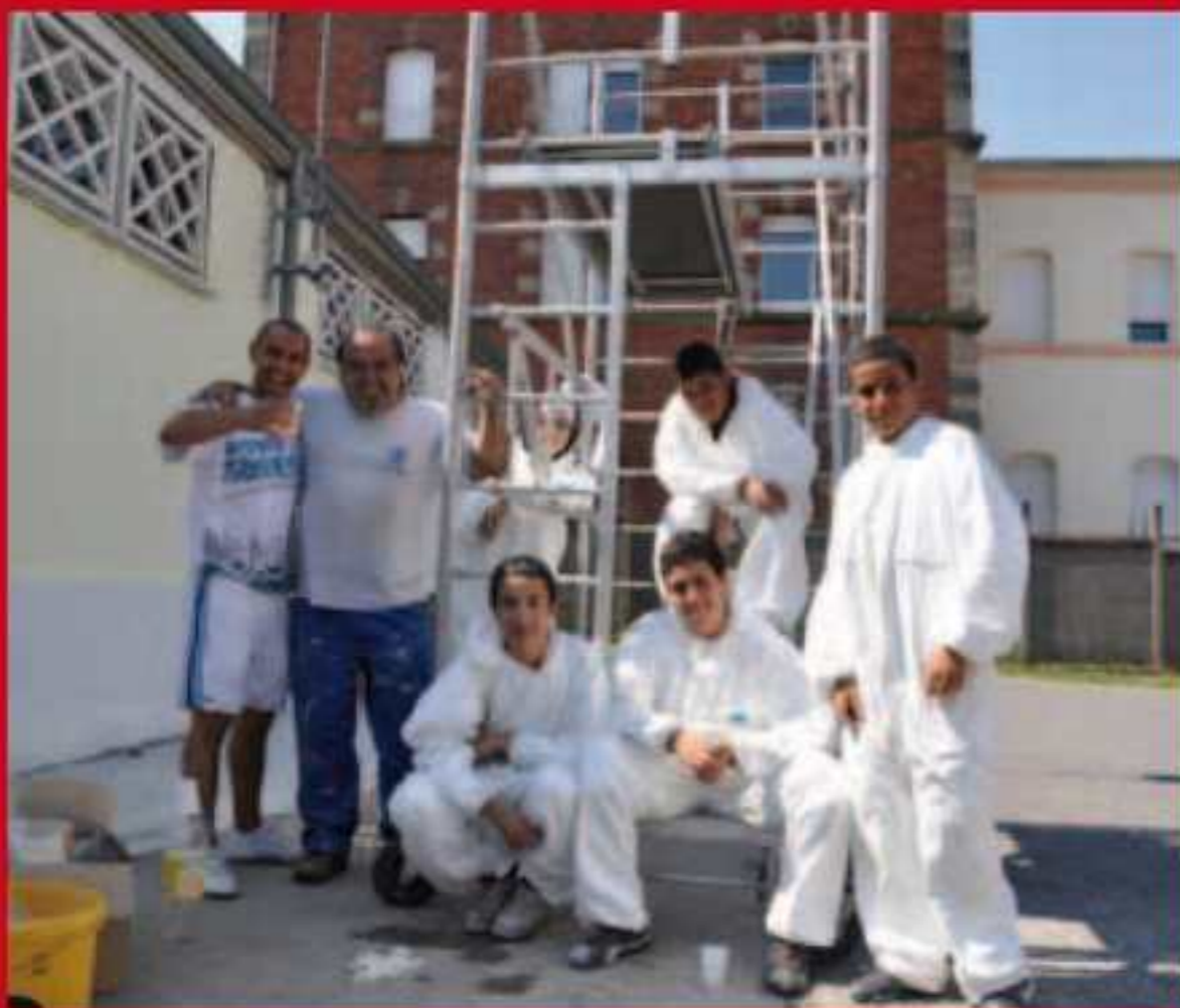
Chantiers jeunes d'été au centre-ville.