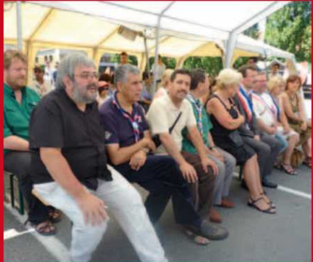
Rencontre internationale des Scouts sur la place Jean-Eric Bousch