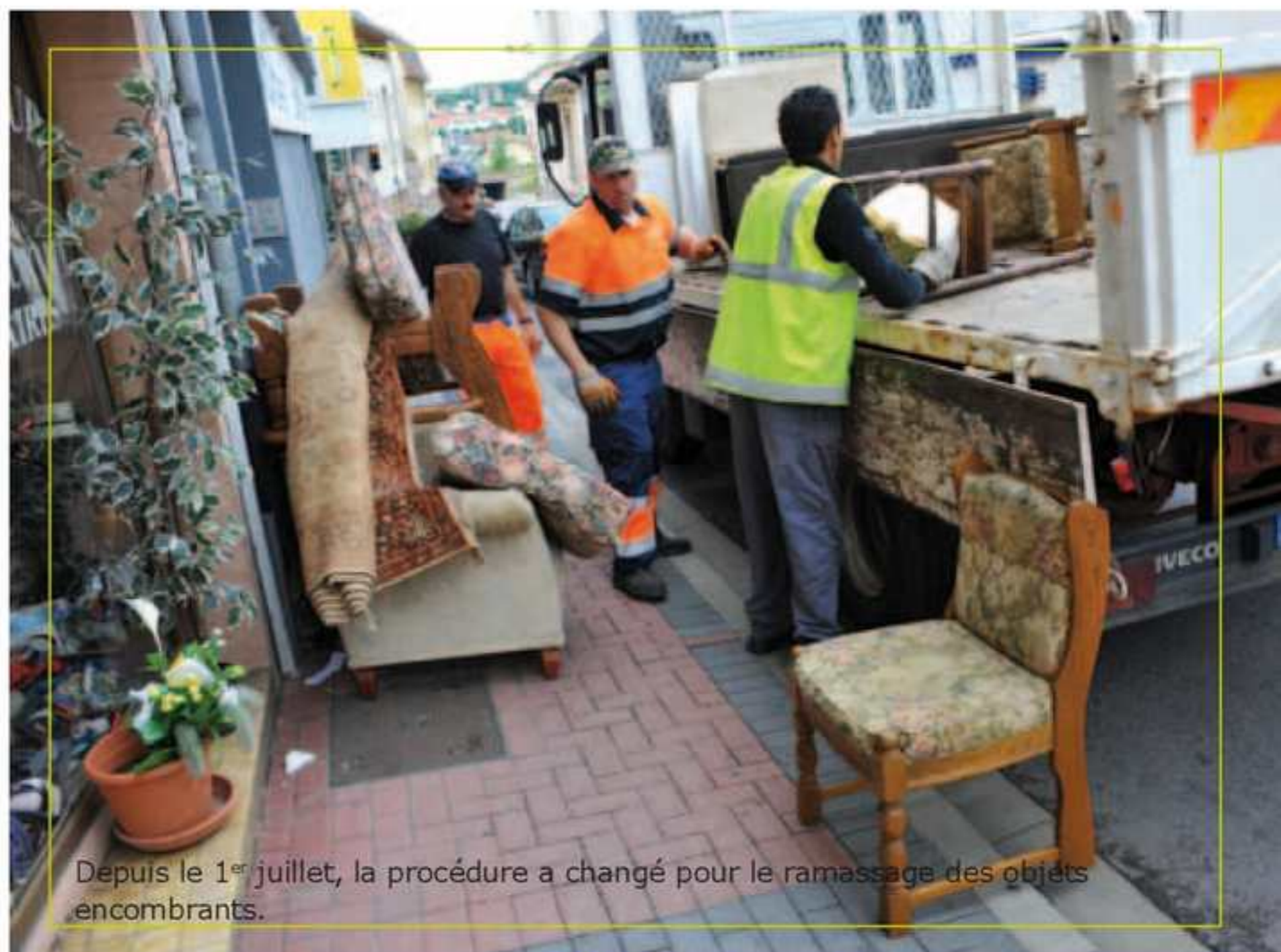
Depuis le 1 er juillet, la procédure a changé pour le ramassage des objets encombrants.