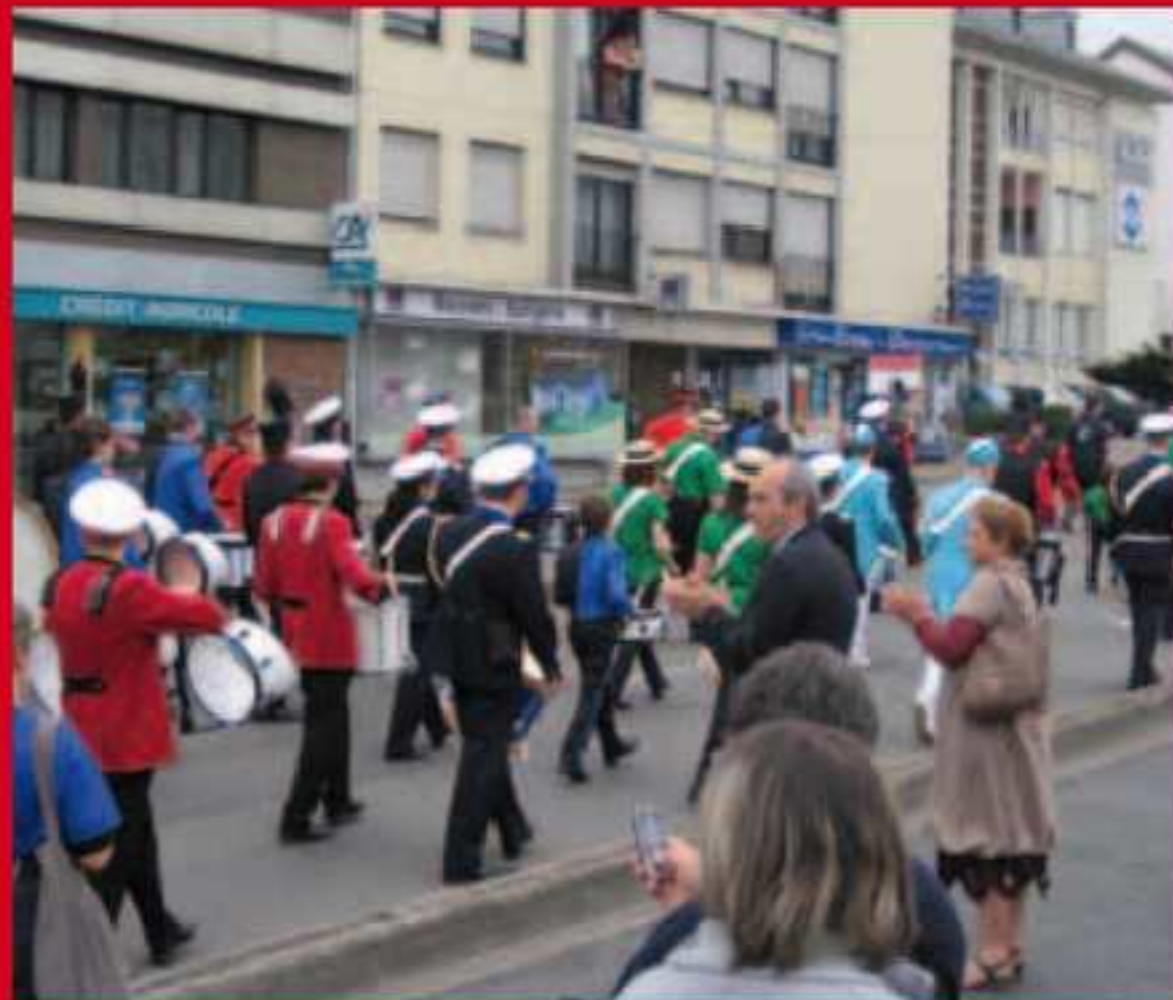
Fanfarades de l'harmonie municipale.