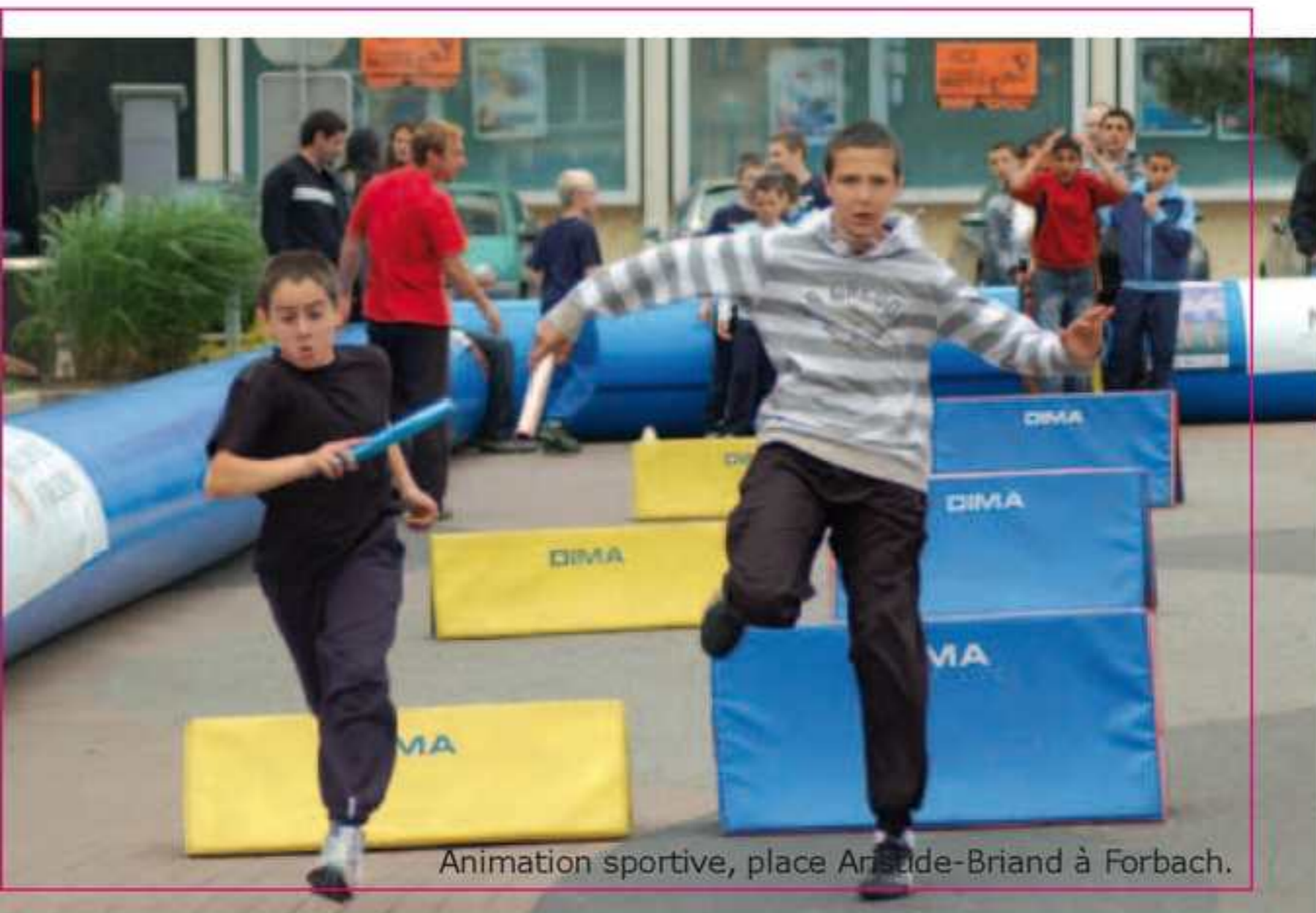
Animation sportive, place Arsède-Briand à Forbach.

Contact : Patrick Ney au 03 87 84 30 50 ou Valérie Ruchaud au 03 87 84 31 40 aux heures d'ouverture de la mairie.