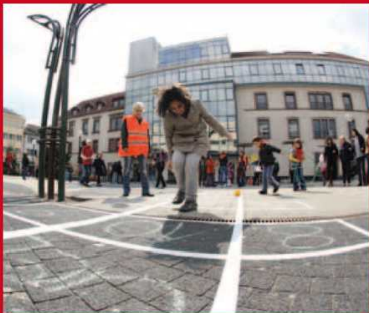
Jeux d'antan sur la place Aristide-Briand avec les centres sociaux de Forbach.