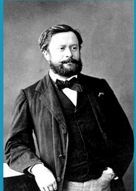
Photographie d'Edmond About

Le Cercle d'histoire locale de Forbach et sa région, Die Furbacher