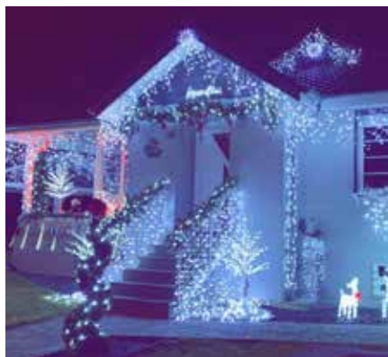
Concours « Maisons illuminées »