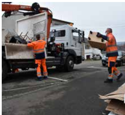
Ramassage des encombrants