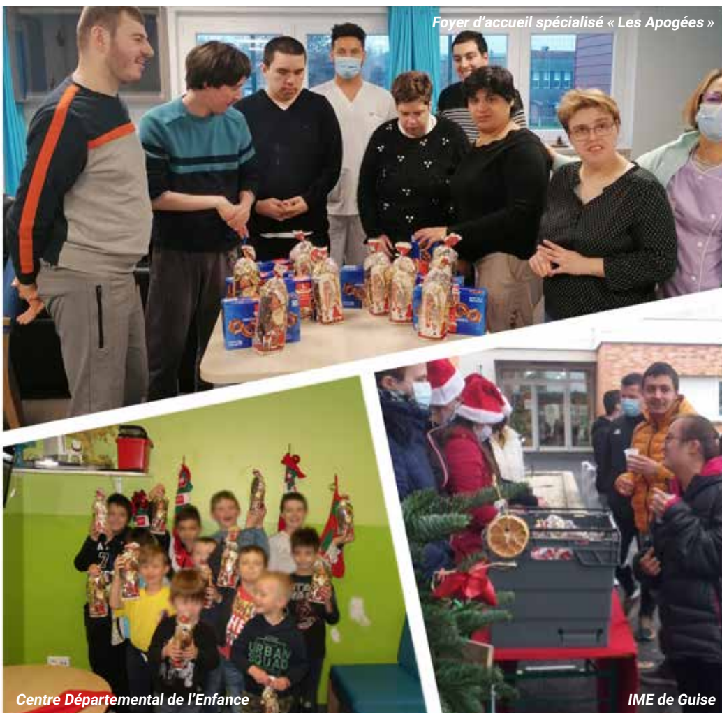
Foyer d'accueil spécialisé « Les Apogées »

Les enfants du Centre Départemental de l'Enfance, ainsi que ceux de l'Institut médico-éducatif de Guise (IME de Guise) n'ont pas été oubliés, puisque le Centre Communal d'Action Sociale leur a fait parvenir des gourmandises. Enfin, le foyer d'accueil spécialisé « Les Apogées » a lui aussi été bénéficiaire de cette opération. Au total, la distribution de sachets de friandises organisée par la Ville a fait pas moins de 991 heureux !