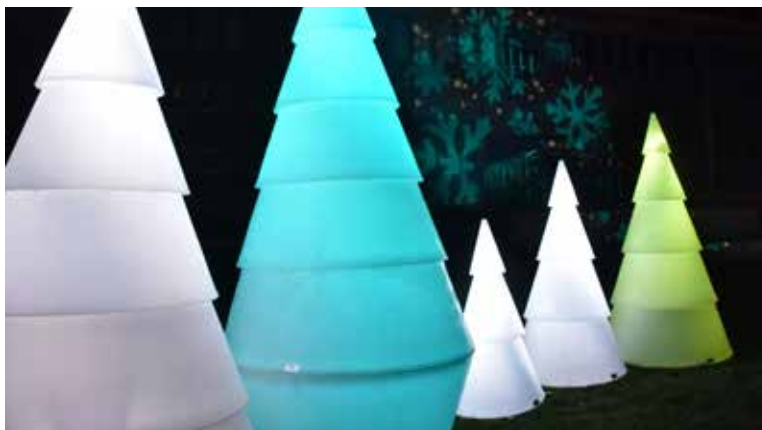
Les sapins lumineux du parvis de l'hôtel de ville

Cette année, à défaut d'avoir l'occasion de se retrouver autour d'un vin chaud au marché de Noël, la Ville met les bouchées doubles pour ses décorations. En effet, grande nouveauté : l'édifice de l'hôtel de ville revêt tous les soirs des couleurs hivernales avec de grands sapins lumineux qui ornent son parvis. Si la Mairie se pare de mille feux à la nuit tombée, les églises et les rues de la ville ne sont pas en reste : guirlandes sur les poteaux, motifs sur les traversées de route ou encore boules lumineuses sur les ronds-points. Forbach célèbre l'arrivée de Noël comme il se doit !