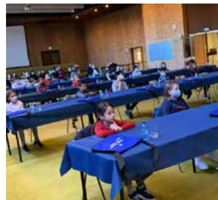
Installation du Conseil Municipal des Jeunes