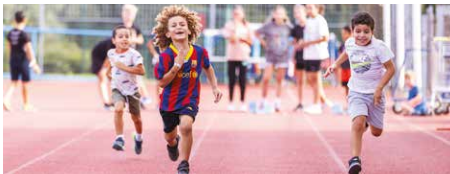
▲ Centenaire du stade : garden party festive au stade du Schlossberg avec plusieurs centaines de familles venues profiter des animations et jeux sportifs.