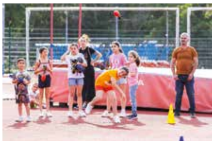
De nombreuses animations ont ravi les enfants lors du centenaire du stade du Schlossberg