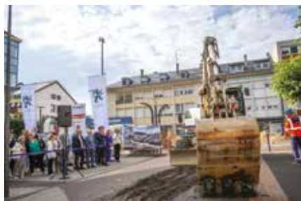
Les travaux Action Cœur de Ville sur la place Aristide Briand sont lancés !