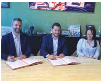
▲ La Ville de Forbach et l'ASBH ont signé une convention de partenariat pour la création d'une webradio pédagogique pour les jeunes.