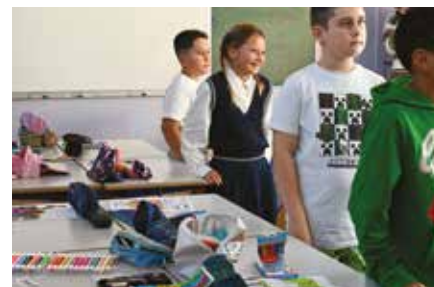
Une rentrée 2023 pour révéler ses talents