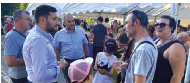
▲ Véritable réussite pour la traditionnelle Krumberkichefest organisée en septembre par le CIA du Creutzberg, pour le plus grand bonheur des gourmands !