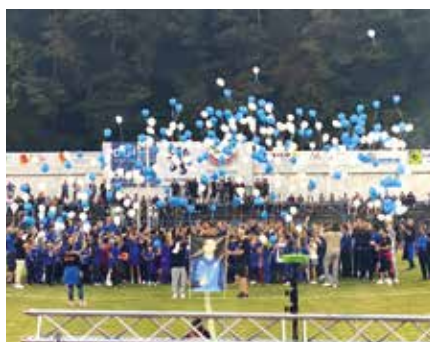
▲ L'US Forbach Football a initié un bel hommage en mémoire de Yanis Zammouri, brutalement décédé. Yanis laisse derrière lui l'image d'un jeune éducateur, engagé et exemplaire.