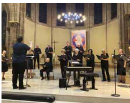
▲ 22 e Festival des orgues transfrontalier : beau succès à l'Eglise Saint-Rémi pour le lancement de l'événement qui se veut ouvert et itinérant.