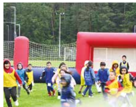
▲ 3 e édition des Eurolympiades mercredi 15 mai 2024 au stade du Schlossberg.