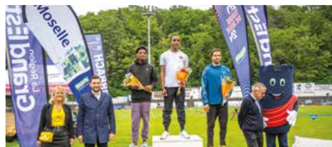
▲ Le Meeting International d'Athlétisme 2024 organisé par l'US Forbach Athlétisme s'est tenu au Stade du Schlossberg dimanche 26 mai.