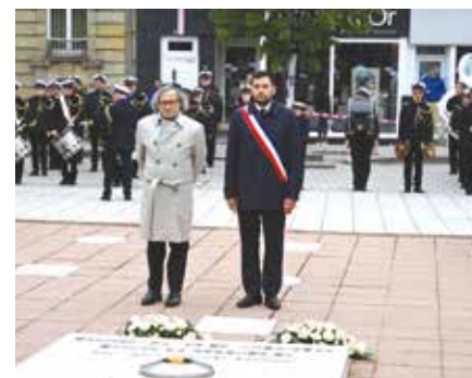
▲ Cérémonie du 28 avril à l'occasion de la Journée Nationale du Souvenir des victimes et des héros de la déportation.