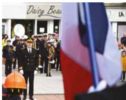
▲ Commémoration de la victoire du 8 mai 1945 au Monument aux Morts de Forbach.