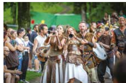
Les 14 et 15 août, la fête médiévale du Schlossberg est de retour