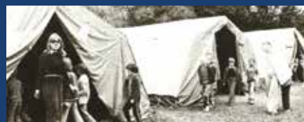
Centre aéré et tentes américaines

Plusieurs destinations sont proposées comme, entre autres, Cannes-la-Bocca (Alpes-Maritimes), Le Brusac (Var), Saint-Brévin (Loire-Atlantique), Valloire (Savoie), Praz-sur-Arly, Lucinges (Haute-Savoie), Virieu-le-Grand (Ain), Chilly-le-Vignoble (Jura), Bains-les-Bains, Trémonzey, Thiétry (Vosges) ... Les colonies de vacances offrent un panel varié d'activités. Encadrés par des moniteurs, les enfants découvrent un nouvel environnement, une autre région, ses paysages, sa faune et sa flore. Ils pratiquent la randonnée, la baignade, le camping, le chant, la voile, l'équitation, les jeux individuels et collectifs... En 1964, 8 000 enfants sont partis en colonie grâce aux HBL. C'est pour eux une ouverture sociale et culturelle. Ils rentrent la tête remplie des souvenirs de vacances à partager à la rentrée !