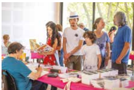
Le Salon du Livre de Forbach a trouvé son public