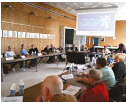
▲ Le nouveau Conseil des Sages a été installé samedi 1 er juin 2024.