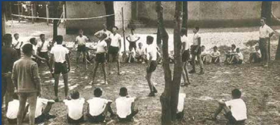
Saint Brévin colonie Atlantique

Les grandes vacances répondent initialement aux besoins du monde rural permettant aux enfants d'agriculteurs de participer aux moissons et aux vendanges. Les colonies de vacances, les centres aérés, les centres de loisirs éducatifs dans les cités (CLEC) gérés par le comité d'entreprise des Houillères du Bassin de Lorraine (HBL) ont rythmé des années 1950 à 1990, la vie de milliers d'enfants, qui en gardent des souvenirs impérissables.