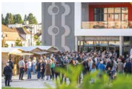
Célébrons ensemble le passage de la flamme à Forbach