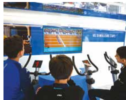
▲ La Ville de Forbach, Terre de Jeux proposait en partenariat avec la Région Grand-Est l'animation itinérante « 3, 2, 1 Faites vos jeux ! » les 28 et 29 mai 2024.