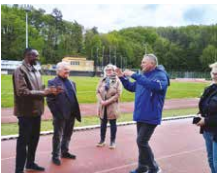
▲ Vendredi 3 mai, la Ville de Forbach accueillait le chef de mission du Comité Olympique Burundais.