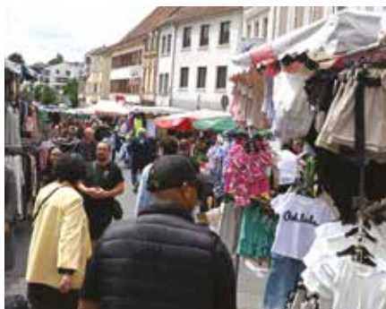
▲ La traditionnelle braderie de Forbach s'est tenue en centre-ville mercredi 5 juin 2024.