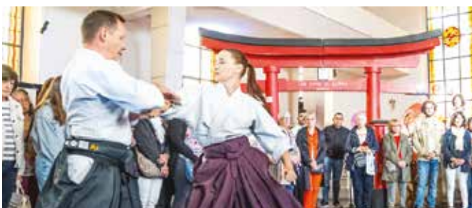
▲ Les Journées Culturelles Japonaises se sont déroulées à La Syna de Forbach les 24, 25 et 26 mai derniers.