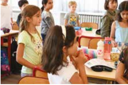
Une rentrée placée sous le signe des découvertes