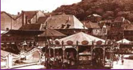
La kirb sur la place Aristide Briand