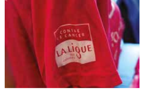
Octobre rose : soirée événementielle le 18 octobre