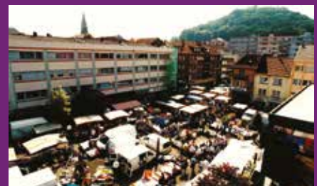
Place du marché fin 90