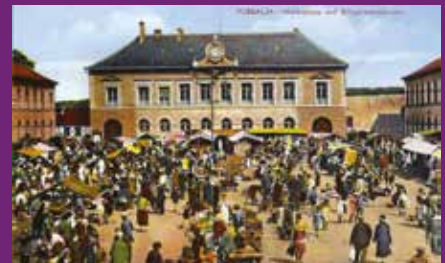
Place du marché avant 1918

Aujourd'hui aussi, après plusieurs mois de travaux, le marché retrouve son emplacement initial, la Place Aristide Briand.