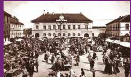
Place du marché années 30