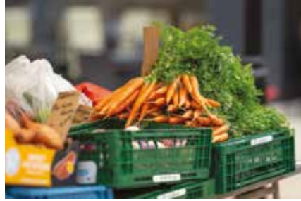
Retour du marché : 50 stands se sont réappropriés la Place Aristide Briand