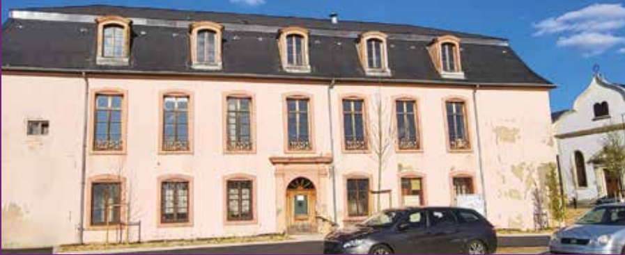
Château Stralenheim côté jardin

Forbach est une ville européenne et humaniste. Tout au long de son histoire, elle a accueilli des personnages illustres et cosmopolites qui l'ont largement fait rayonner. Aussi découvrons le destin d'un homme haut en couleur.