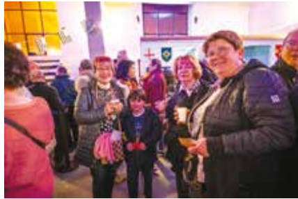
La culture bretonne fait voyager à la Syna