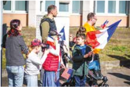
La ville a fêté en grande pompe les 80 ans de la libération de Forbach