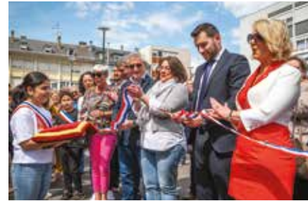
Le marché des saveurs est de retour avec des surprises